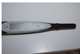
▲ダイアグノデント

虫歯を数値で正確に測定 する装置です。衛生士が 虫歯かな?と思つた歯に この機械を当てて数値が 高かったら削ったりなど の治療が必要です。数値