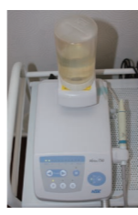
▲超音波スケーラー

歯の表面に着いた歯垢や 歯と歯茎の間に入り込ん だ汚れを、超音波と専用 の薬剤で除去、清掃する 装置です。