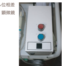
▲ビジュアル位相差 顕微鏡

ビジュアル位相差顕微鏡 お口の中の細菌や微生物 の動画を直接モニターで 見る事の出来る機器です。